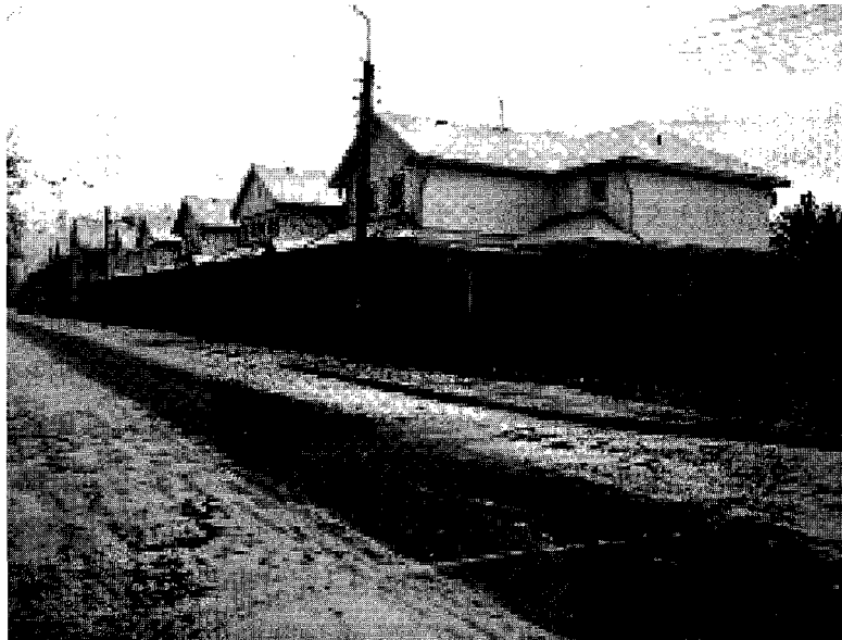
写真-2 カナダ住宅の家並み

比較的安いカナダコテージの価格で、約 5.5 万ドルである。これは土地代込みである。モスクワであれば 3 倍ぐらいの値段になる。ここはまだ土地代が安い。