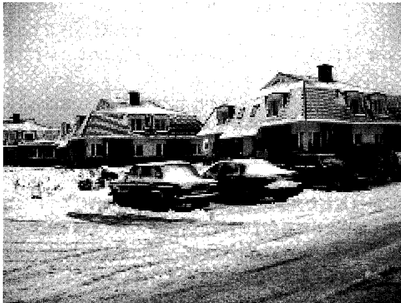
写真-1：ノボゴルスクの低層住宅団地

うど雪の日であった。コテージやタウンハウスが立ち並び、日本の住宅団地を思い起こさせるものであった。住宅の外観はレンガ壁がほとんどで欧風の雰囲気があり、かなり豪華に見えた。同じような外観の家が並んでいた。日本と比べて住宅の外観をあまり変えていない。住宅団地全体に景観上の統一性をもたせているようだ。庭も広く、ゆったりとした感じで、一戸当たりの敷地面積も日本より広いと思う。団地内で建設中の家もある。価格的には、8万ドルほどの住宅が平均的である。ちょうど訪問当日は、雪が5~10cm 降り積もり、住民が庭先や道路の雪かきをし、トラックが除雪作業をしていた。これも日本の降雪地域の団地と同じような光景であった。まさに、郊外一戸建住宅団地における中流市民の生活がそこにあった。しかし、公共交通の利便性特に都心へのアクセスは充分ではなく、マイカーなしには買い物等にも不便で、暮らしぶりではないかと感じた。さらにマイカーがあっても、朝夕のラッシュ時の交通渋滞は大きな問題であるらしい。この付近には地下鉄駅がなく、やはり地下鉄の延長等の措置が必要であろう。なお、団地の周囲はフェンス等で囲われ、入り口ではガードマンが団地への出入りをチェックしていた。なお、この会社が建設したもう一つの住宅団地である「クニャジチ」団地は、時間の都合で訪問を断念した。