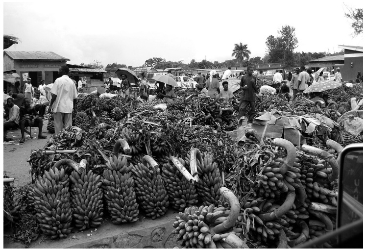
二エンド市場のマトケ（食用バナナ）売り場、ウガンダ・マサカ県にて 2010年1月筆者撮影